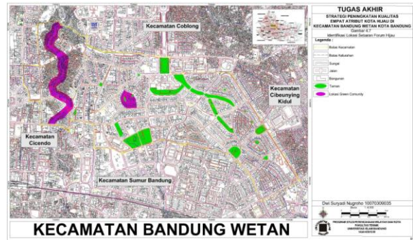
Gambar 8 Identifikasi Lokasi Sebaran Forum Hijau

Hubungan kolerasi antara kegiatan empat atribut green city yang terdiri atas kegiatan penanaman pohon, luas RTH, jumlah pengguna sepeda, panjang jalur sepeda, jumlah komunitas pengelolaan sampah dan jumlah komunitas hijau terhadap pengaruh kualitas lingkungan yang diwakilkan oleh indikator kadar CO, kebisingan, debu dan volume sampah di Kecamatan Bandung Wetan.