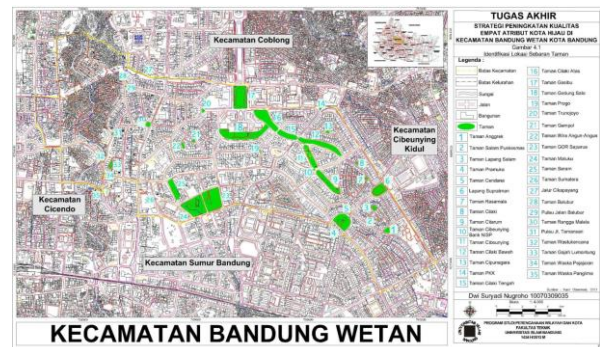
Gambar 3 Identifikasi Lokasi Sebaran Taman

Green Transportation di Kecamatan Bandung Wetan terdiri atas panjang jalur sepeda dan jumlah shelter sepeda. Total keberadaan jalur hijau di Kecamatan Bandung Wetan seluas 5.220 m dan terdapat 2 shelter sepeda.