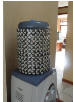
(a) Produk green community Dari recycle sampah un-organik