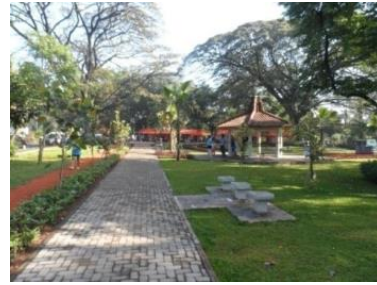
(a) Taman Cibeunying