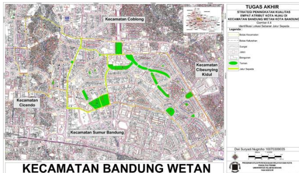
Gambar 5 Identifikasi Lokasi Sebaran Jalur Sepeda

Green Community (komunitas hijau) di Kecamatan Bandung Wetan terdiri atas