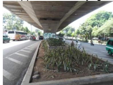
(d) Taman Jalur Cikapayang