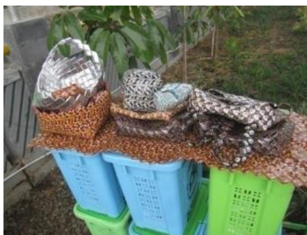
(b) kerajinan tangan dari sampah un-organik