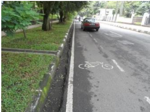
(b) Jalur Jl. Aceh