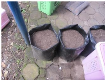
(a) Kompos dari sampah organik