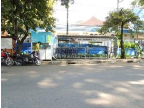
(a) Shelter di Jl. Ranggamalela