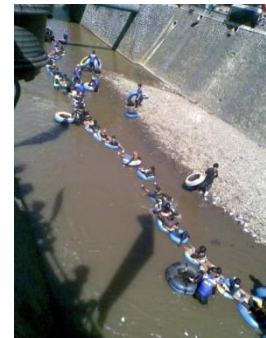
(b) Komunitas Kuya 13