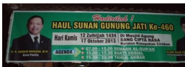
Gambar 2 Foto Anggota DPR RI periode 2009 -2014 sebagai Ketua Panitia Haul 460 Sunan Gunung Jati Di Keraton Kasepuhan Cirebon