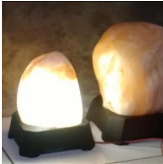
Gambar 3. Kerajinan Hiasan Lampu Onyx