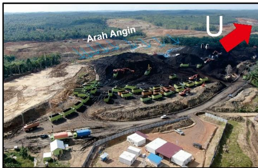
Gambar 1. Sketsa Arah Angin

Pengamatan arah angin ini dilakukan pada pagi hari pukul 09.00 WIB. Dalam pengamatan arah angin stockpile batubara ini, peneliti menggunakan 2 batang kayu sebagai tiang yang masing-masing ditancapkan pada stockpile 1 dan pada stockpile 2 . Kemudian peneliti melilitkan ataupun memasang tali pita di batang kayu tersebut lalu peneliti menggunakan kompas di handphone untuk menentukan arah mata angin dan melihat tali pita tersebut arahnya kemana. Berdasarkan hasil pengamatan arah angin pada stockpile batubara yang dilakukan oleh peneliti di PT Era Perkasa Mining pada stockpile 1 dan stockpile 2 yaitu arah angin dominan dari arah timur stockpile menuju arah barat stockpile sehingga arah angin tersebut menabrak stockpile 1 dan stockpile 2 (Akbar et al., 2022; Ilya Rahma Putri & Dudi Nasrudin Usman, 2022; Yodi Kurniawan et al., 2023).