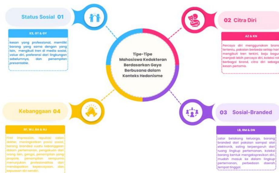
Gambar 1. Bagan Tipe-Tipe Mahasiswa Fakultas Kedokteran Berdasarkan Pemakaian Gaya Berbusana dalam Konteks Hedonisme