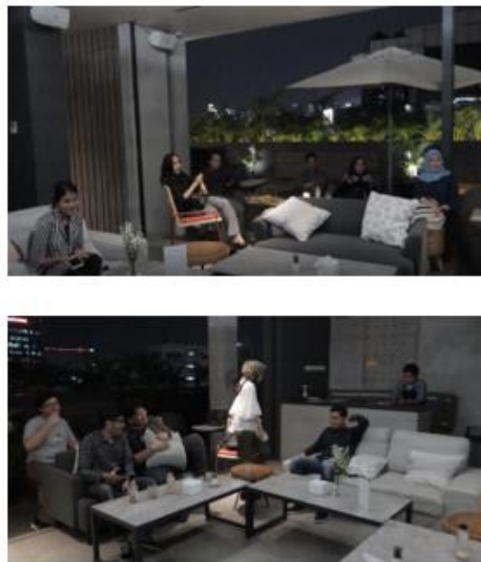
Gambar 13. Konsep coffee shop ( Go Green ).